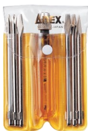
No.1095-H 高圧 スパープラグ検電用