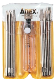
No.1095-L 低圧 交流AC：100～220V