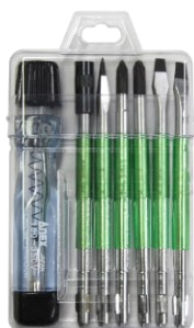
No.2095-L 低圧 交流AC：100～220V