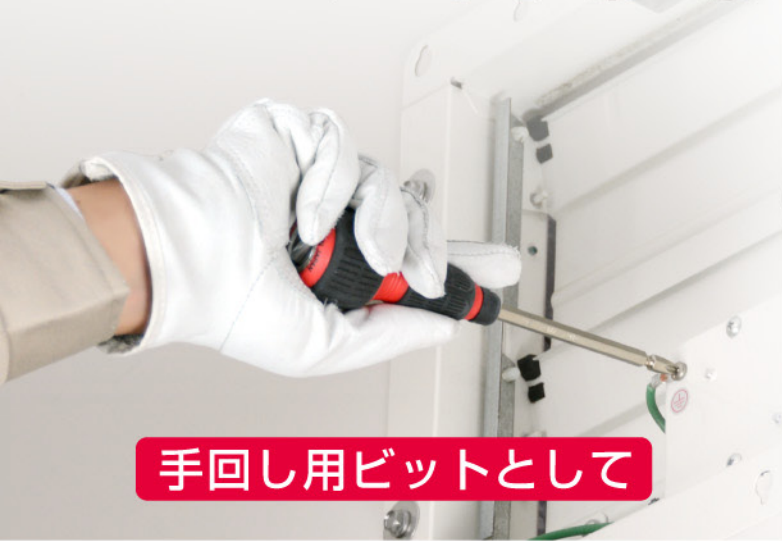
手回し用ビットとして