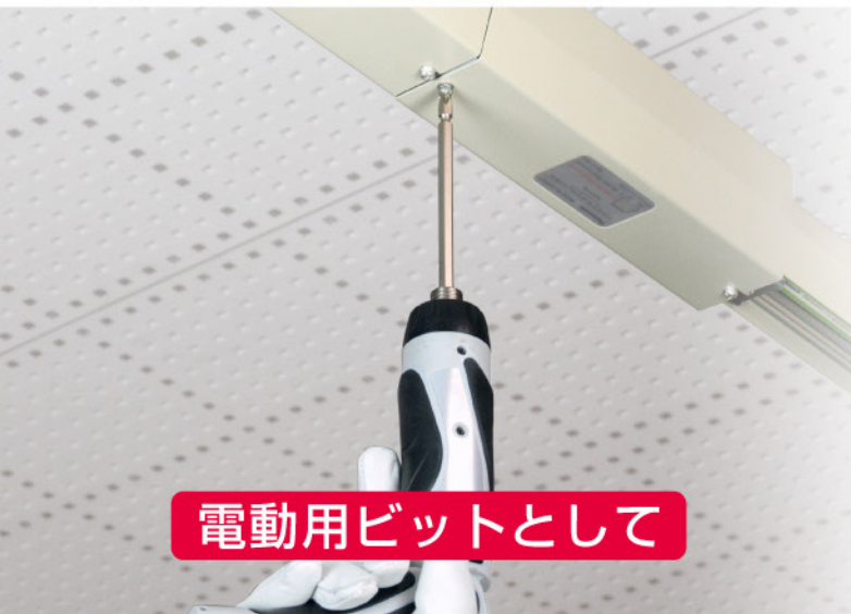
電動用ビットとして