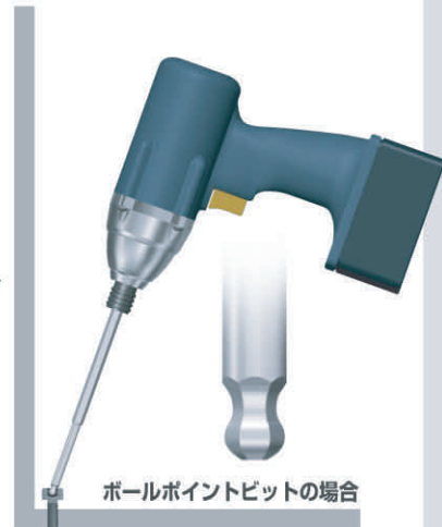
ボールポイントビットの場合