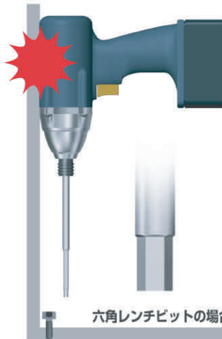
六角レンチビットの場合