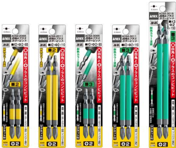
ACS2-2065 ACS2-2011 ACS2-3065 ACS2-3011 ACS2-3015