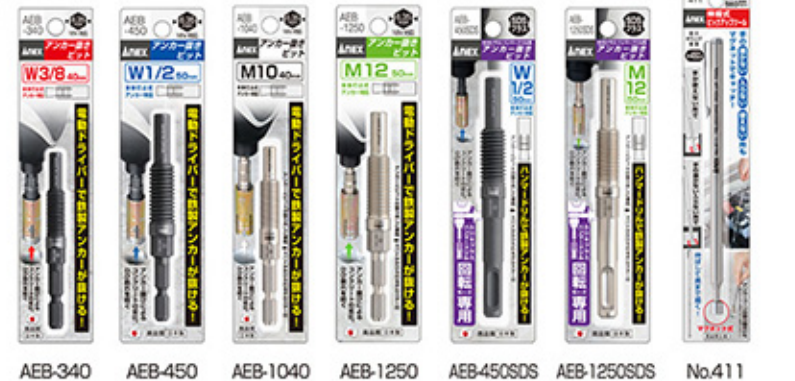
アンカー抜きビット 6.35mm六角軸