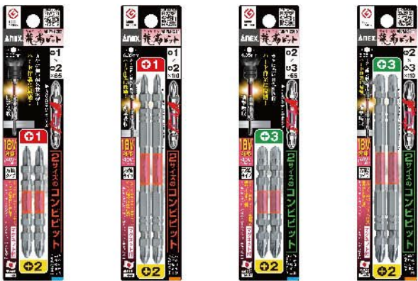
ARPM-1265 ARPM-1211 ARPM-2365 ARPM-2311