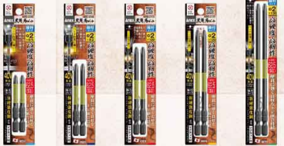
ABRD-2065 ABRD-2082 ABRD-2100 ABRD-2120 ABRD-2150

新硬強度鋼の採用によりHRC 62.5（最高硬度）の高い硬度を実現。 刃先の耐摩耗性を上げ、ハードな作業でも刃先の精度が従来品以上に維持されます。また独自の熱処理によって生まれた高靱性により折れに強く、高い耐久性を確保します。