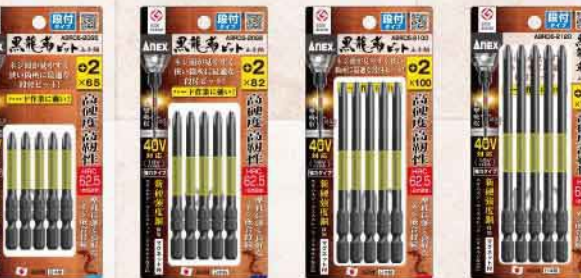
ABRD5-2065 ABRD5-2082 ABRD5-2100 ABRD5-2120