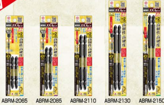
ABRM-2065 ABRM-2085 ABRM-2110 ABRM-2130 ABRM-2150