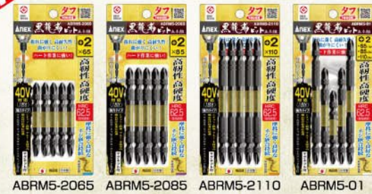
ABRM5-2065 ABRM5-2085 ABRM5-2110 ABRM5-01