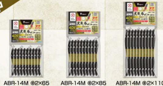
ABR-14M ②×65 ABR-14M ②×85 ABR-14M ②×110