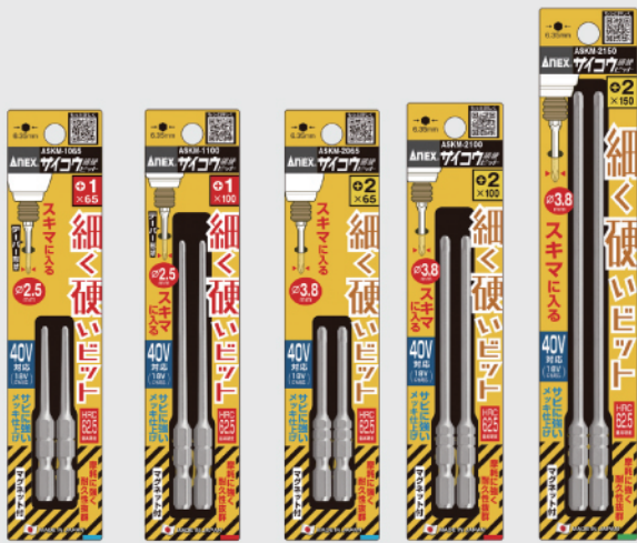
ASKM-1065 ASKM-1100 ASKM-2065 ASKM-2100 ASKM-2150